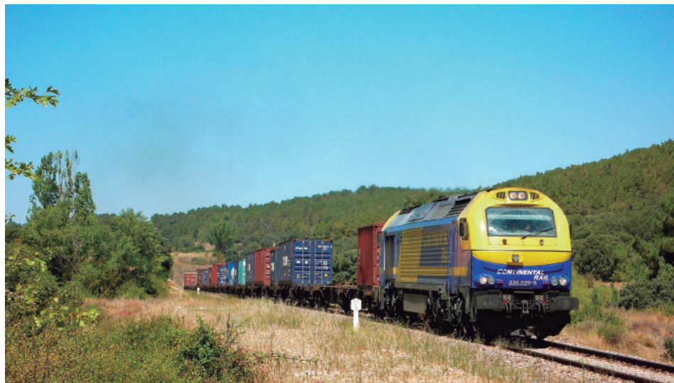
Tras salir del túnel nº 3 y superar los 18 kms de rampa continua, un tren de contenedores Bilbao-Silla, de la E.F. Continental Rail, corona el Puerto del Alto.

Sin duda, el año 2017 y tras más de dos décadas, será recordado como el año del resurgir del tráfico de mercancías por la antigua ruta del Central de Aragón. Desde el año 2010, de la mano de las empresas privadas Logitrén y Continental Rail, ya se pudo apreciar un tímido retorno de trenes de mercancías a la línea Zaragoza – Valencia. Posteriormente, en el año 2015, fue Renfe-Mercancías quien inició los tráficos de automóviles al puerto de Valencia, que con varias interrupciones temporales, se ha mantenido regularmente en la línea. Pero fue a partir del 1 de octubre de este año, cuando hubo un punto y aparte en el tráfico de mercancías con la programación de 15 trenes semanales, multiplicando por cinco los existentes