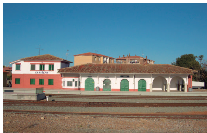
“Estación de Cariñena.”