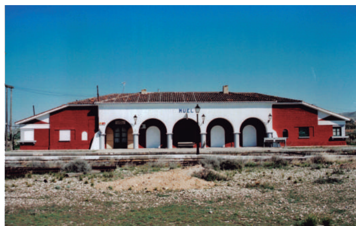
“Estación de Muel.”