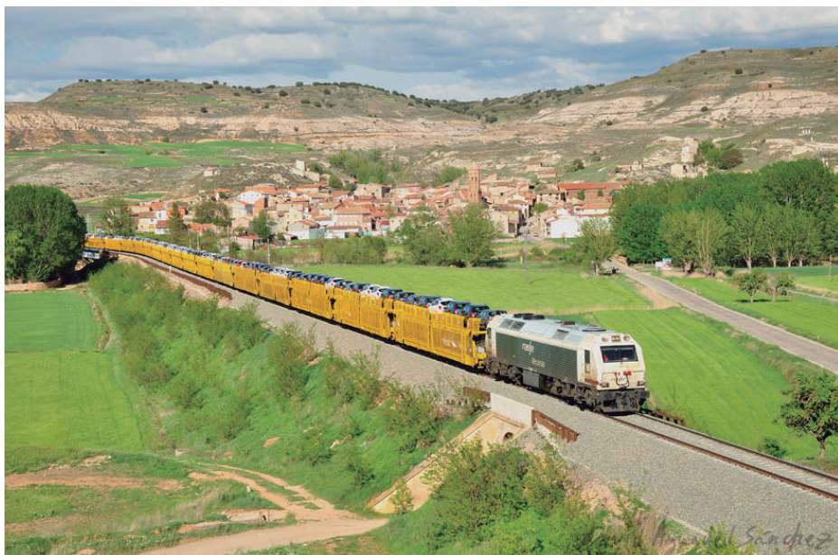
Los trenes de automóviles, como el de la imagen circulando a la altura de la localidad de Navarrete, se han convertido ya en un clásico en la línea Zaragoza – Valencia.

hasta esa fecha. Desde entonces, las empresas ferroviarias Renfe Mercancías y COMSA, pusieron en circulación cada una de ellas 2 trenes semanales cargados de automóviles entre la factoría OPEL/PSA en Grisen y el puerto de Valencia y los consiguientes retornos en vacío. A su vez, se anunció el regreso de los trenes de bobinas a la línea de la mano de la operadora estatal, con 2 circulaciones vacías y dos cargadas semanales, además del incremento de un tren semanal de Continental Rail, pasando de 2 a 3 frecuencias, de su consolidado tráfico de contenedores en la línea entre Bilbao y Silla. Posteriormente, fue el día 24 de octubre cuando la operadora ferroviaria ACCIONA, inició sus tráficos ocasionales de contenedores entre Zaragoza Plaza y Valencia, habiéndose consolidado en principio con una frecuencia semanal.