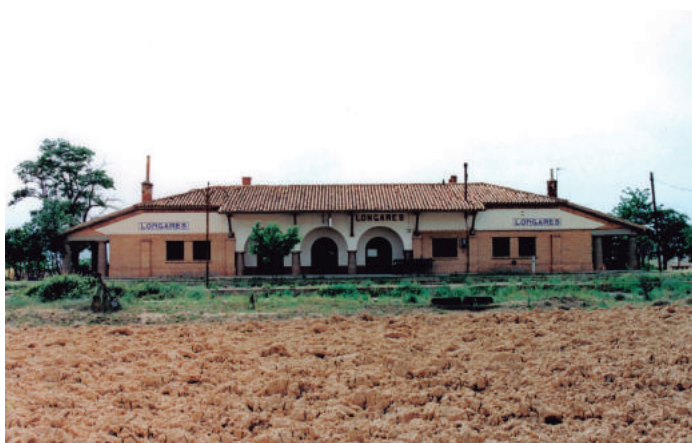
“Estación de Longares.”