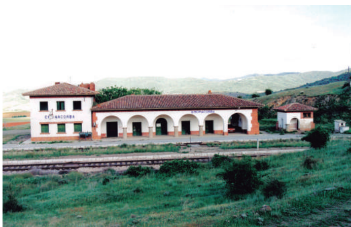
“Estación de Encinacorba.”

Hoy en día y por diversos motivos, los edificios han corrido suerte dispar. Mientras algunos edificios han desaparecido, otros han quedado fuera de trazado por construcción de variante, también los hay que, aunque se conservan en un aceptable estado, ya no cumplen la función para la que fueron construidos. Solamente el de Cariñena es el único edificio, que además de conservarse en muy buenas condiciones, cumple actualmente con la función ferroviaria para la que fue creado, habiendo tenido a la largo de su historias algunas reformas y modificaciones para adaptarse a los tiempos que le ha tocado vivir.