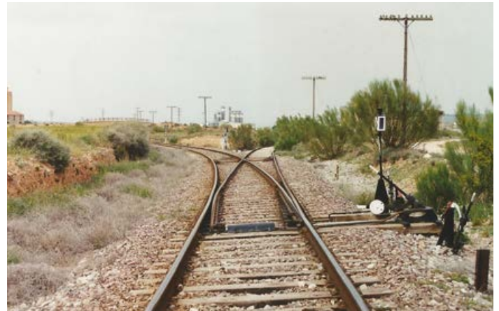
Aguja de acceso al cargadero, ubicada en el pk 90+125 de la línea Caminreal-Zaragoza.

junio de 2006, coincidiendo con las obras de reforma integral del trayecto Cariñena-Muel. Oficialmente y con fecha 18 de julio de 2006, quedó definitivamente clausurado el cargadero de Cementos Portland y anulada toda su documentación de gestión y regulación asociada. El día 20 de noviembre de 2006 entró en servicio un nuevo trazado en variante en ese punto, dejando al margen las antiguas instalaciones del cargadero y cualquier posibilidad de retorno a su actividad ferroviaria.