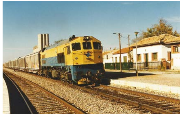
Uno de los últimos trenes, con 9 vagones tipo JJPD cargados de cemento, a su paso por la estación de Cariñena, el día 9 de noviembre de 1998.