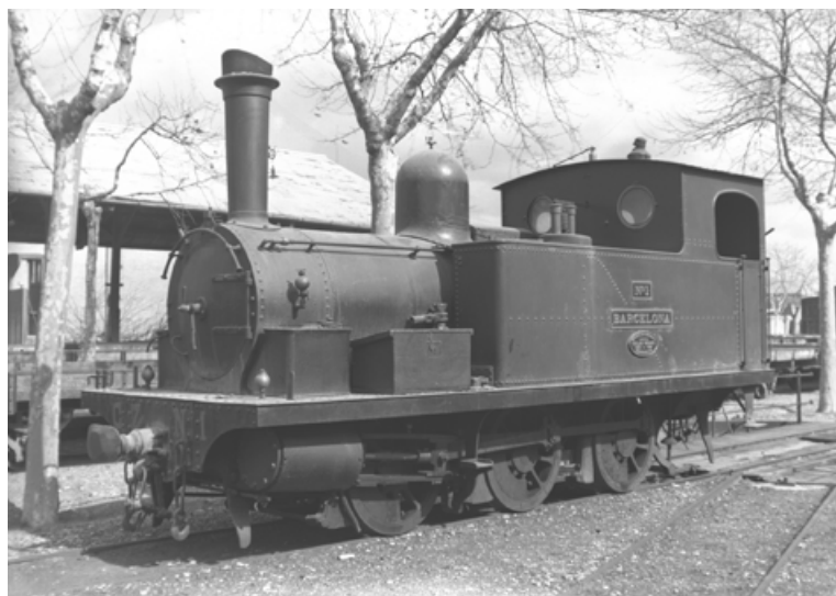
Locomotora nº 1 "Barcelona" del Ferrocarril Cariñena – Zaragoza, apartada en la estación de Zaragoza tras la clausura de la línea en el año 1933.