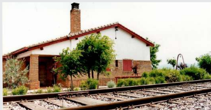
La casilla del pk 73+900 en el término de Cariñena, es la que mejor estado de conservación presenta.