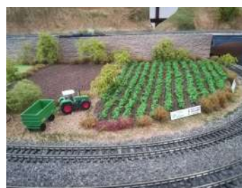
Reproducción de un viñedo, a modo de guiño a nuestro territorio.

singular forma de divulgación de nuestro territorio a través del modelismo ferroviario a escala 1:160.