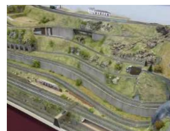
Vista parcial de la maqueta, en donde se aprecian los diferentes niveles de la misma.