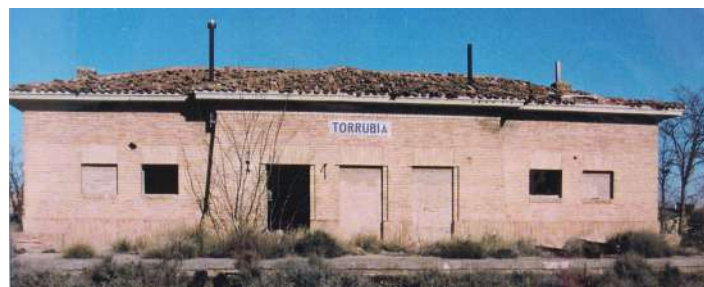
Edificio del apartadero de La Torrubia, meses antes de ser demolido.