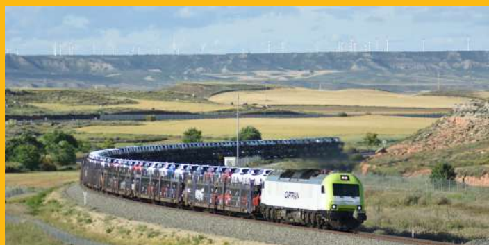
Locomotora híbrida BITRAC serie 601, a su paso por la curva de La Torrubia entre Muel y Longares estación de Cariñena.