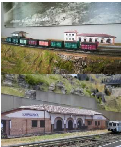
Las réplicas de las estaciones de Encinacorba y Longares, presentes en la maqueta.

Los trabajos de decoración se han ido adaptando al trazado de los circuitos, siendo especialmente complejos en algunos puntos y siempre intentando dejar visible la mayor parte del trazado, evitando túneles innecesarios. Aunque no representa ninguna zona concreta, el proyecto contempla diversos guiños a nuestra Comarca, con réplicas a escala de diferentes rincones