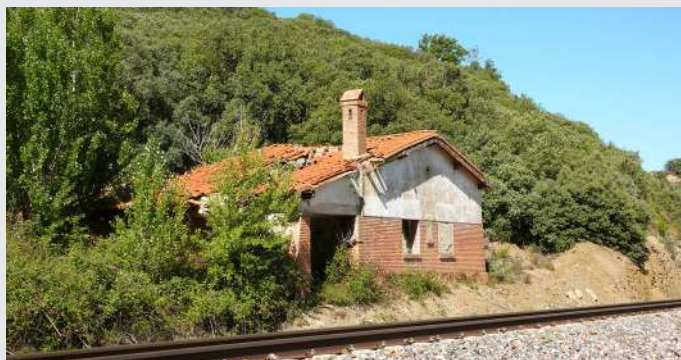
Casilla del Puerto, ubicada en el pk 53+900, entre los túneles 3 y 4, presenta un avanzado estado de abandono.

Hoy en día tan solo quedan en buen estado de conservación tres de ellas, quedando restos, en diferente grado de ruina, de otras seis e inexistentes el resto.