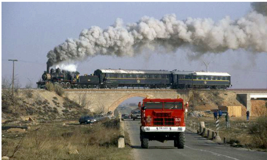
Tren conmemorativo de la fundación de la Asociación, cruzando el antiguo trazado de la N 330, en las proximidades de Cariñena. 20-12-1990.