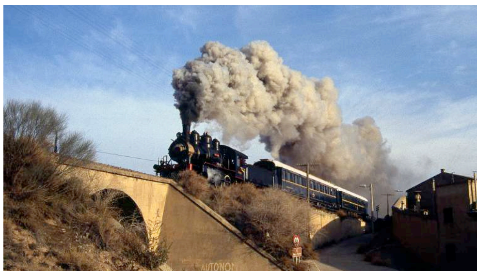
La Baldwin, a cargo del tren conmemorativo, empleándose a fondo a la salida del apeadero de Arañales de Muel. 20-12-1990.

Aunque supuso un serio revés a los ánimos de todos los socios, la Asociación de Amigos del F.C “pro Esla 10” y lejos de desanimarse, reorientó sus actividades a la investigación y divulgación de la historia del ferrocarril en Cariñena y su Comarca. Así y durante los primeros ocho años, se celebraron semanas culturales del ferrocarril, que supusieron las primeras acciones divulgativas, con exposiciones y charlas relacionadas con nuestro ferrocarril. También se inició la publicación anual del boletín “Vía Estrecha”, que en estos treinta años no ha faltado a su cita y que ha sido uno de los instrumentos de divulgación del resultado de múltiples investigaciones sobre nuestro ferrocarril. Igualmente y durante cinco años, se creó una sección filatélica, con la creación de matasellos conmemorativos.