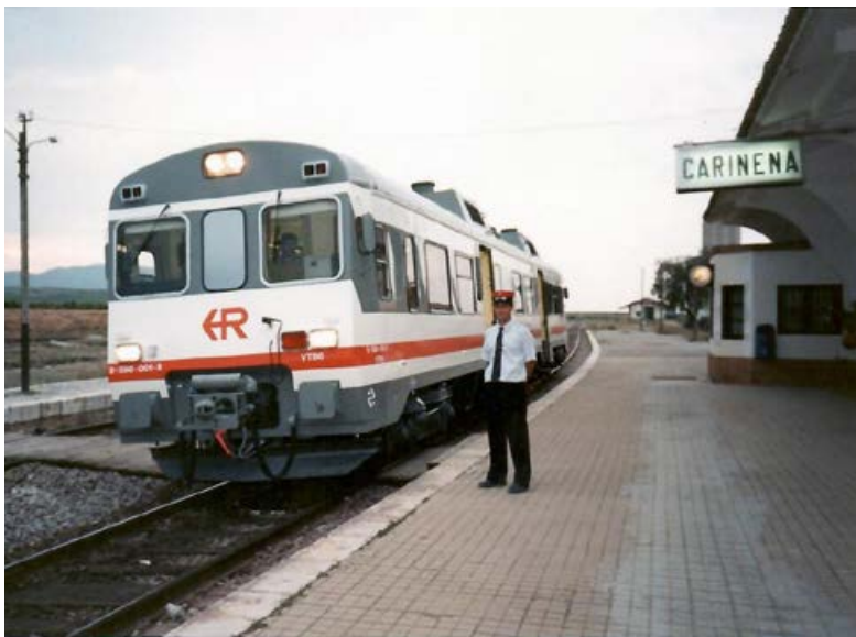
Primera circulación de un automotor serie 596, realizando el servicio Zaragoza-Teruel. Estación de Cariñena 8/09/1997.

La casualidad quiso que se tardara exactamente un año para que los automotores FIAT de la serie 596 volviesen a realizar servicios comerciales en la línea Zaragoza-Valencia, así el día 8 de septiembre de 1998 comienza el servicio regular de estos automotores en la línea, impulsados también por el reciente convenio Renfe-Gobierno de Aragón, que los incluía en ciertos servicios deficitarios de la Comunidad Autónoma. A partir de esa fecha y tras ser dotado el depósito de Zaragoza de 6 unidades, se hacen cargo de la relación Zaragoza – Teruel en ambos sentidos, posteriormente se incorporaron en la relación Teruel - Valencia y viceversa, en este caso alternándose en ciertas ocasiones con las unidades de la serie 592 del depósito de Valencia. Los comienzos de estos automotores en la línea Zaragoza – Valencia fueron más bien discretos y en ocasiones pésimos. Numerosos problemas de índole mecánico y de adherencia ocasionaron múltiples incidencias y retrasos durante los primeros meses de servicio. Progresivamente y gracias a la destreza y experiencia, tanto del personal de talleres de Zaragoza como de los maquinistas, se fueron subsanando estos problemas hasta conseguir la realización de