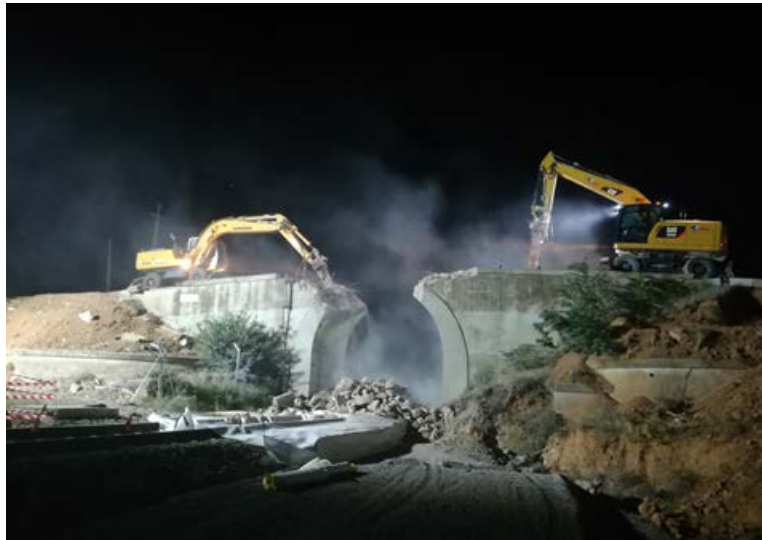
El puente de La Platera, en plena fase de demolición.

en ese año, por lo tanto serán 89 los años que este emblemático puente habrá estado al servicio de la localidad. Sin duda, una de las infraestructuras más antiguas y simbólicas de Cariñena, que ya es un recuerdo. El último tren en cruzar el antiguo puente fue el Regional nº 18517 Zaragoza-Teruel, servido por el automotor 594.010 a las 20:45 h., a continuación se procedió a la demolición del puente, labores que duraron toda la noche.