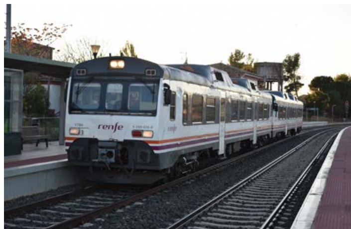
Última circulación de automotores serie 596, circulando en DC, realizando el servicio Teruel – Zaragoza. Estación de Cariñena 11/11/2020.

Así pues, se puso punto y final a la etapa de unos trenes, que si bien su concepción fue la idónea para atender servicios de baja demanda, a lo largo de los años no tuvo un relevo generacional con trenes similares de nueva construcción. A partir de la fecha indicada, de nuevo los automotores de la serie 594, en una versión más modernizada que en su anterior presencia en la línea, se encargan de realizar los servicios Zaragoza-Teruel-Zaragoza.