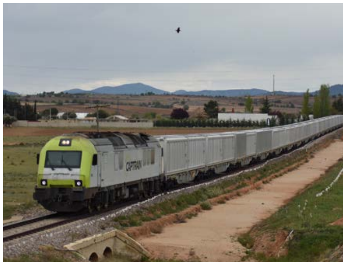
Tren del azúcar entrando en la estación de Cariñena, en donde ya se apreciaba la explanada de la futura ampliación de la vía 7. 13/04/2021.