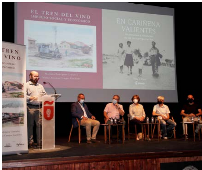
El libro fue presentado en el Cine Olimpia de Cariñena, junto a otra publicación de ámbito local.