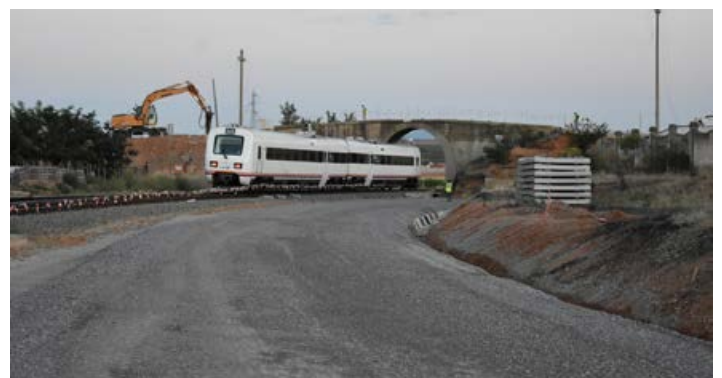
20.45 h. del día 27/08/2021, último tren que franquea el antiguo puente de La Platera.