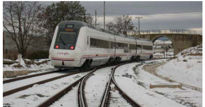
Media Distancia Zaragoza-Valencia, saliendo de la estación de Cariñena. Invierno 2019.