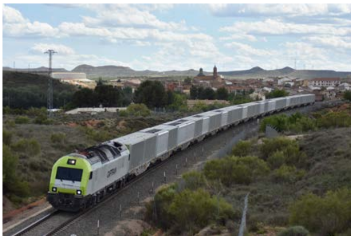
Tren del azúcar a su paso por Muel. 18/05/2021.

se realiza por la ruta Valencia - Teruel - Zaragoza – Pamplona - Irún. La tracción se reparte entre Captrain España para el tramo peninsular, normalmente con locomotoras series 335 y 601 y Fret SNCF para el francés. La composición habitual consta de 17 vagones plataforma serie Sgns de VTG, con equipos intermodales específicos de aluminio (contenedores VRAC 30 FT 56 M3) para productos alimentarios de la compañía francesa especializada en material rodante Combipass. Los martes ha sido el día habitual de la circulación en vacío del tren dirección a la frontera francesa y aunque en principio lo hizo en horario nocturno, posteriormente pasó a hacerlo en horario diurno, pudiendo ser inmortalizado al paso por nuestra Comarca.