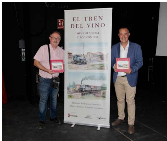
Tras la presentación, los autores posan satisfechos con el libro. ■ Foto: Enrique Tejero.

Tras su presentación en Cariñena, el libro también ha sido presentado en Longares, Muel, María de Huerva y Zaragoza, emulando así la ruta que este tren estuvo realizando durante 46 años. En próximas fechas, El Tren del Vino, viajará a otros importantes enclaves fuera de Aragón, para continuar con su presentación y seguir divulgando esta importante etapa de la historia de la Comarca Campo de Cariñena, como lo fue la llegada del ferrocarril.